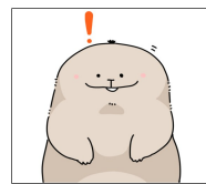
毛布たん LINEスタンプ販売中!